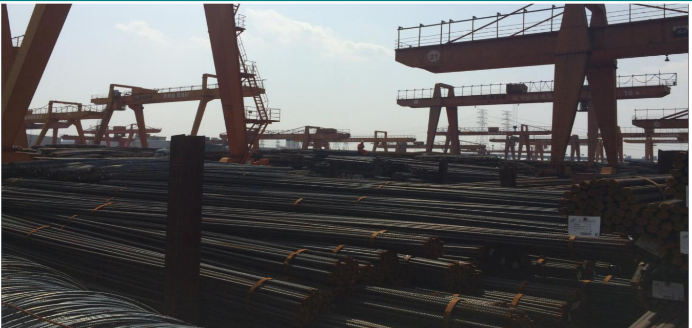
图表 2: 崇贤港螺纹堆场 2: