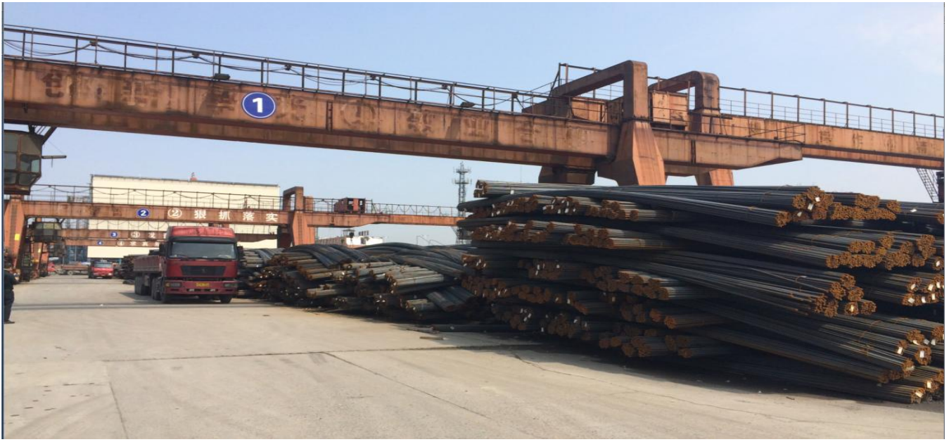
图表 1: 崇贤港螺纹堆场 1: