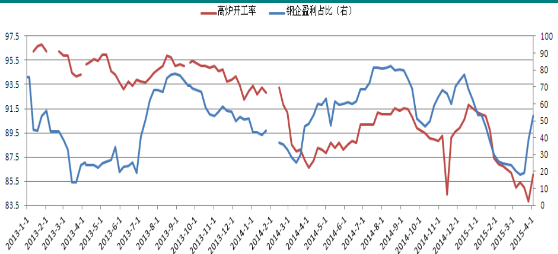
图表 5: 钢企盈利以及高炉开工

环保方面，本周数据来看，随着多地环保部门调研结束，在高利润的刺激下，钢厂复产热情增加，全国高炉开工 86.05%，较上周大幅增加 2.21%，后期钢材供给又将回到高位。